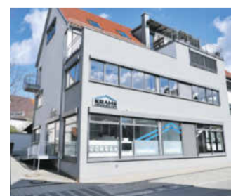
Neue Büroräume in Metzingen

In der Immobilienverwaltung kümmern sich spezialisierte KRAMS-Mitarbeiterinnen und Mitarbeiter seit 2004 um das Management und den Wert-