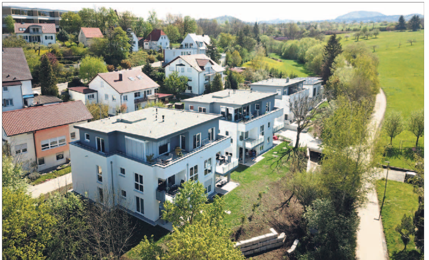
Ein elegantes Entrée schuf Krams Immobilien in Bempflingen.

BEMPFLINGEN. Der erste Eindruck zählt – das gilt auch für Kommunen. Das Entrée von Bempflingen hat jetzt eine moderne und sehr elegante Aufwertung erfahren, weil unter der Adresse Metzinger Straße 11 bis 11/4 zwei Mehrfamilienhäuser, ein Doppelhaus sowie ein Einfamilienhaus neu entstanden sind. Das Besondere daran ist ihre unmittelbare Nähe zum Steidenbach, der daher in das bauliche Gesamtkonzept mit eingebunden wurde.