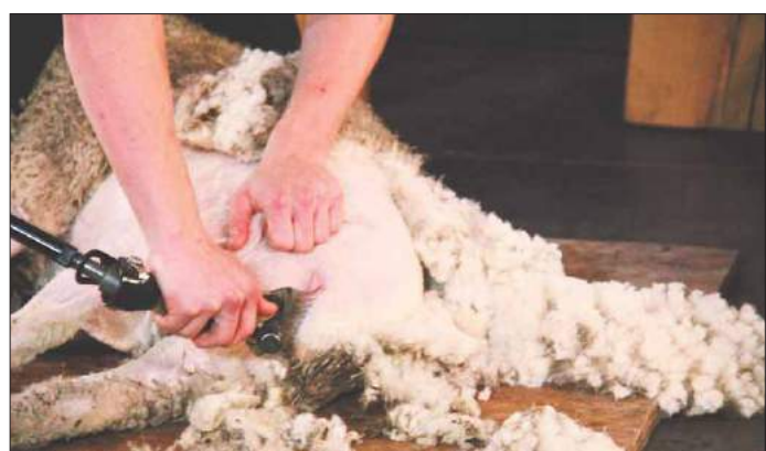
Bei der Slow Schaf gibt es viel Programm rund um die Tiere.

Jede Stunde wird die oder der Schnellste der vergangenen 60 Minuten im Melken der Ziege Rosamunde ermittelt und gewinnt einen Gutschein. Es geht um Merinoschafe und was es bedeutet, Schäferin zu sein. Um die Marke »Württemberg