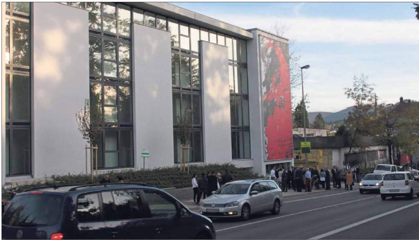
Für jeden sichtbar: klassischer Expressionismus an Reutlingens neuestem, schicken Apartmenthaus.

Apartmenthaus eingeweiht – abstrakte Kunst von Ulrich Lukaszewitz dominiert die Hauswand