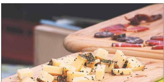
Viele Versucherle warten auf die Besucher.

-pi/rw www.schoen-und-gut.com www.slowschaf.de