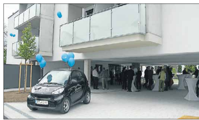
Großes Interesse zeigten auch die Gäste bei der Einweihung.