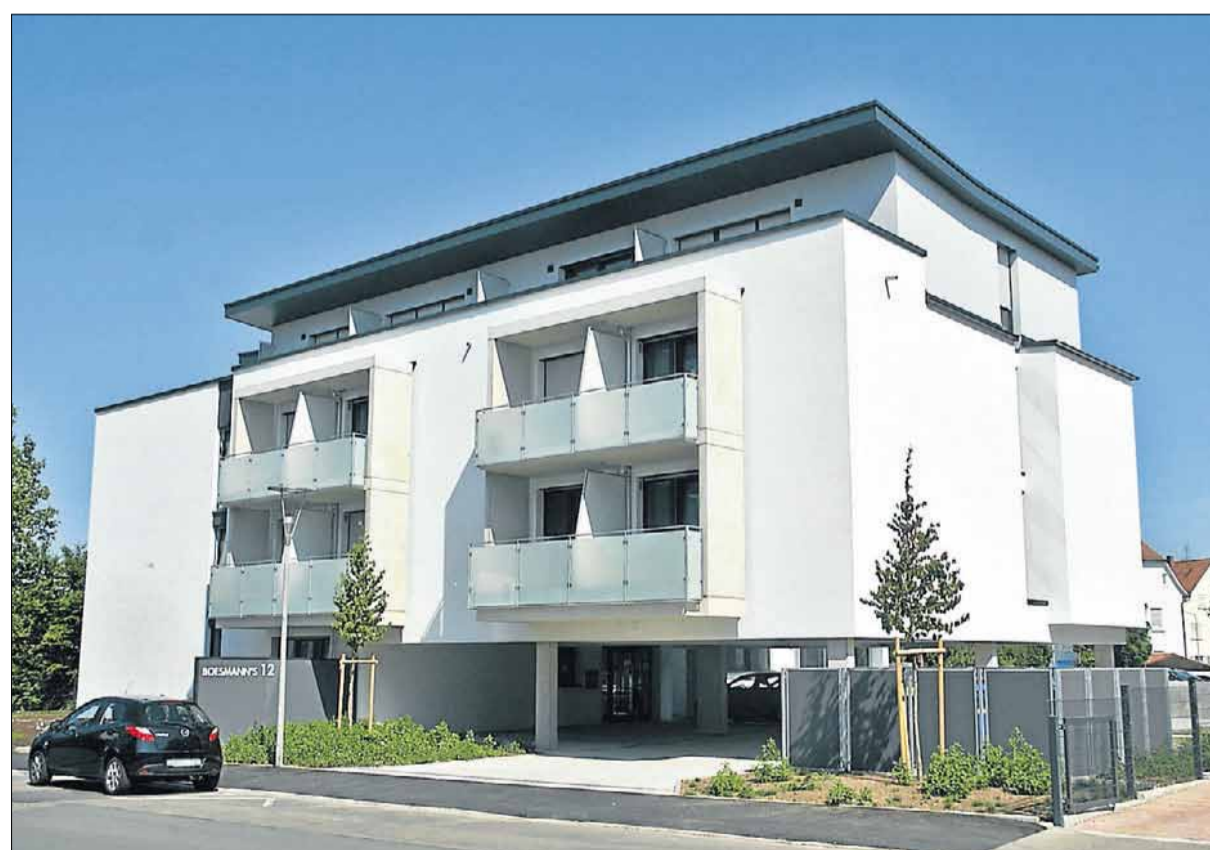
Das neu errichtete Business-Apartmenthaus »BOESMANN'S« von der Südseite aus.

Die hochwertig möblierten Apartments seien nach einem