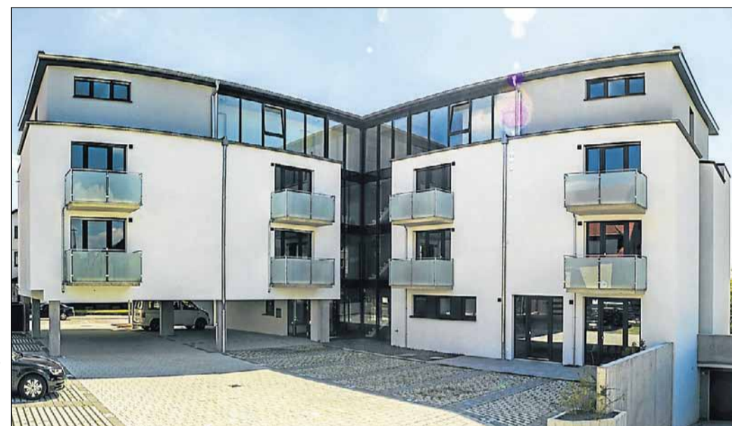
Durch die Anordnung des Gebäudekörpers ergibt sich ein schöner Innenhof.

REUTLINGEN. Bereits am 18. Mai wurde das Apartmenthaus »BOESMANN'S« im Rahmen eines Einweihungsfestes feierlich seiner Bestimmung übergeben. Rund 100 Investoren und Gäste seien begeistert von der erfolgreichen Konzeption und der qualitativ hochwertigen Bauausführung gewesen, so die KRAMS Immobilien GmbH mit Sitz in Reutlingen.