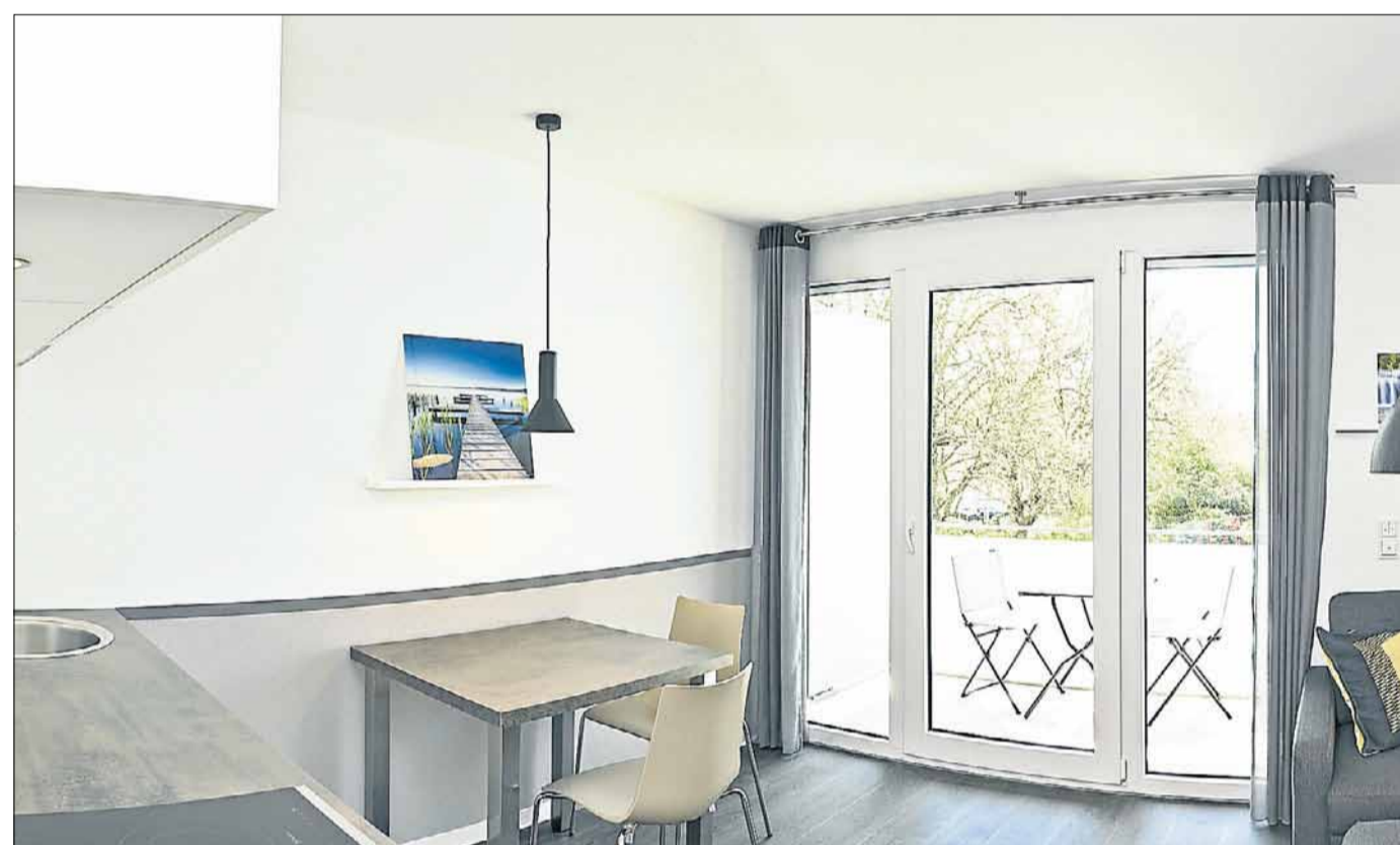
Eine kleine Küchenzeile, eine Essgelegenheit sowie ein gemütliches Sofa gehören zur Einrichtung dazu.

durchdachten Konzept aufgeteilt und verfügen jeweils über einen eigenen Balkon oder eine Terrasse. Die Größen reichen von circa 24 bis 56 Quadratmeter Wohnfläche und sind monatlich bereits ab 370 Euro Kaltmiete anzumieten. In den Nebenkosten zusätzlich bereits mitinbegriffen sind Internet- und Stromkosten. Die Bewohner können lediglich mit ihrem Koffer anreisen, ohne den Stress eines aufwendigen Umzugs zu stemmen.