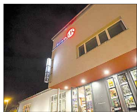
Ab heute gibt's im franz.K reichlich »Kultur vom Rande«.

Und bei allen kommt schließlich etwas heraus, was mit Rock/Pop/Jazz zu tun hat, aber doch ganz andere Welten mit aufhebt. Der Festival-Sonntag soll zusätzlich die verschiedenen Welten in und aus Reutlingen in einem bunten Programm zusammenführen – mit Kinderprogramm, Beiträgen von Reutlinger Vereinen und Bands/Musiker, die hier zusammengefunden haben. Bei freiem