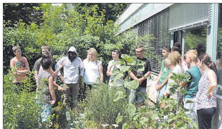
Schüler und Lehrer der Gutenbergschule im Garten.